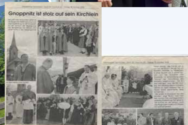
Einweihung des Gnoppnitzer Kirchlein 1998