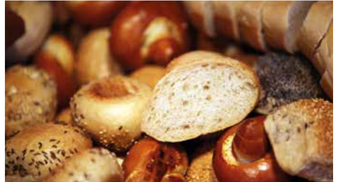
Einladung zum Brunch