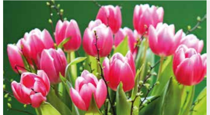
Frühlingserwachen in pink