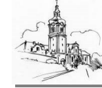
St. Michael Odenheim