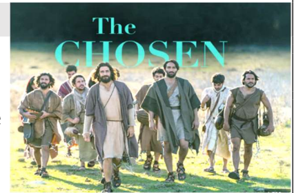
The Chosen, Inc.

Wir laden herzlich ein !!!! Gemeinsam diese großartige Serie „The CHOSEN“ (1. Staffel) anzuschauen und das Leben Jesus zu betrachten!