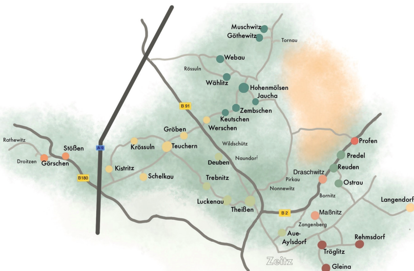
Karte Nördliches Zeitz mit farbigen Gemeinden und Kirchspielen

Damit keine Kirche und keine Gemeinde vergessen wird, brauchen wir auch in der nächsten Legislatur wieder Menschen, die in ihren Ort und ihre Kirche im Gemeindegkirchenrat und auch im Regionalbeirat vertreten.