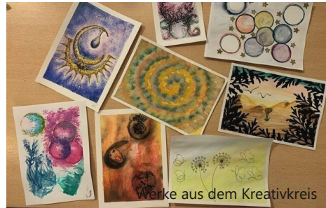
Werke aus dem Kreativkreis