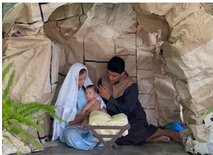
Weihnacht in einer Schule des "Heims des Armen Kindes" v. Mossoró

Liebe Wohltäter in Stätzling von der Pfarrei St. Georg, lieber Bastelkreis und lieber Gartenbauverein!