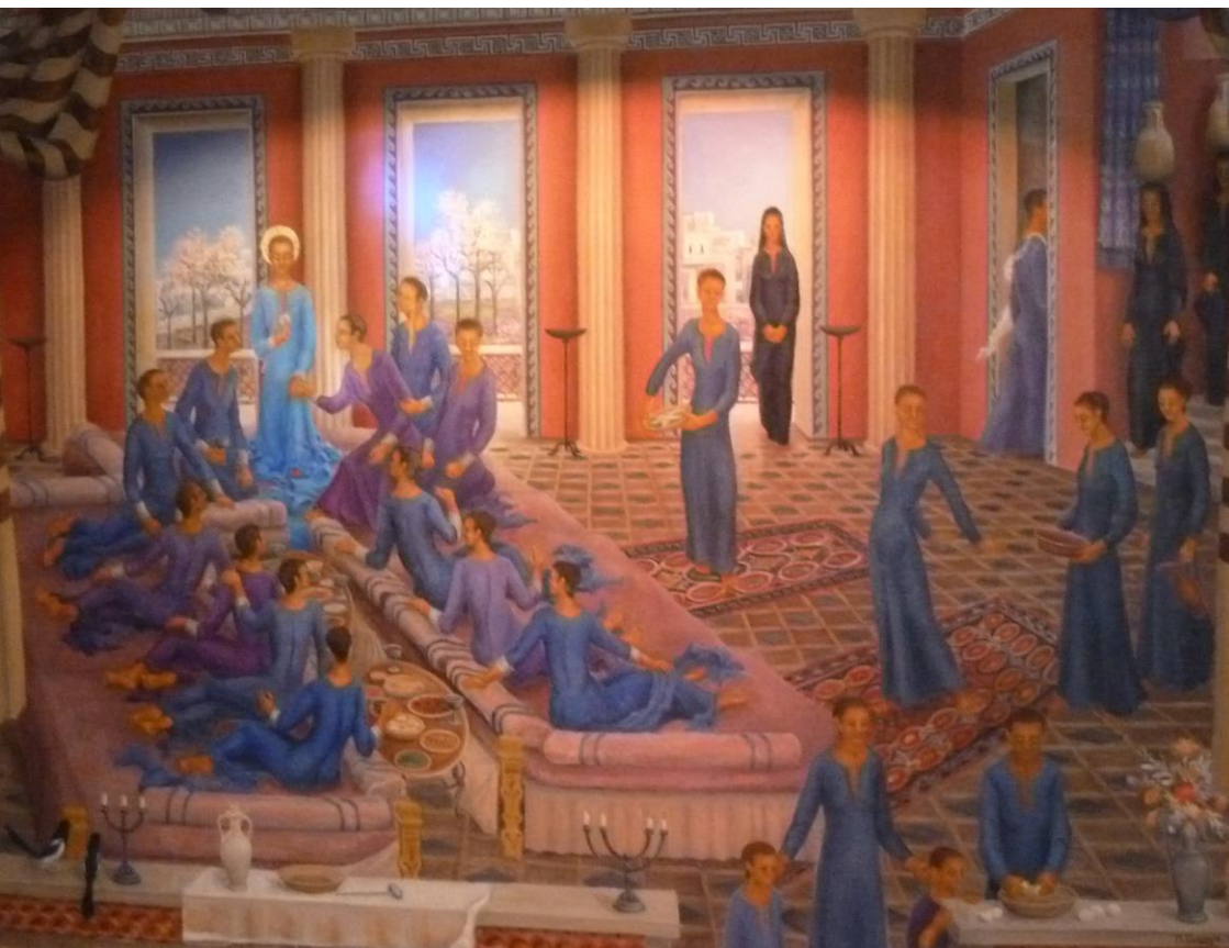
Santa María la Mayor Ronda

Euer Herz lasse sich nicht verwirren. Glaubte an Gott und glaubte an mich!