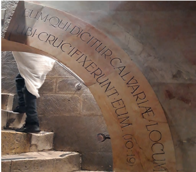
Jerusalem, Grabeskirche mit Inschrift: „Der Ort, der Golgatha genannt wird. Dort kreuzigten sie ihn.“

Seht, wir gehen hinauf nach Jerusalem, und es wird alles vollendet werden, was geschrieben ist durch die Propheten von dem Menschensohn (Lukas 18,31).