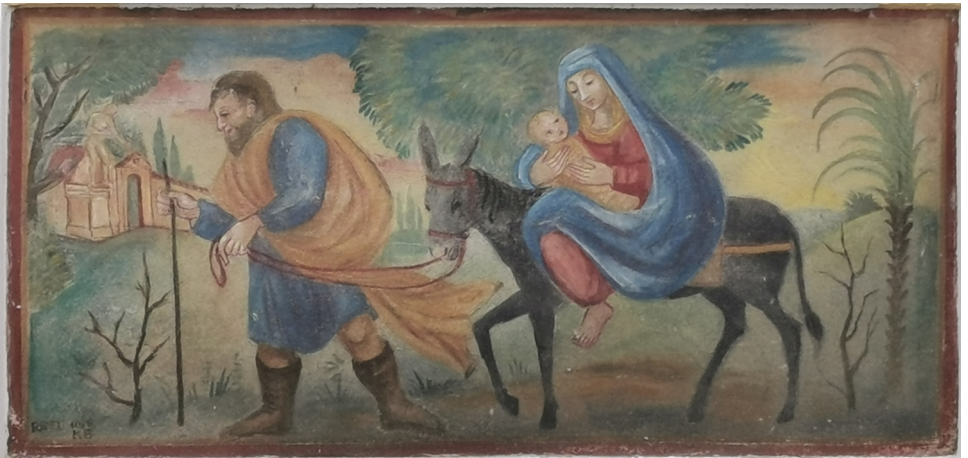
„Auf der Flucht“ ein Wandbild der Heiligen Familie in Schärding, Österreich

In dieser Ausgabe: Unsere Pläne für Advent und Weihnachten