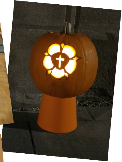
Kehrd werd... - Lutherkürbis