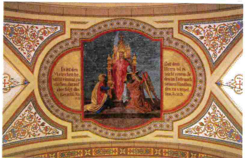
Jesus Christus als Weltenrichter

Preise niemanden glücklich vor seinem Ende und an seinen Kindern wird ein Mann erkannt.