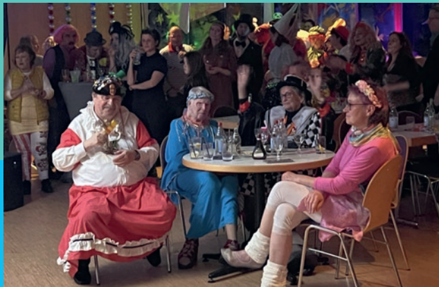
Promi- und Seniorentisch bei der Boni-Fasnet.