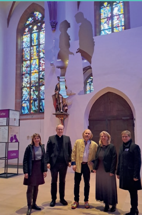
Aschermittwoch der Künstlerinnen und Künstler in der Stiftskirche.