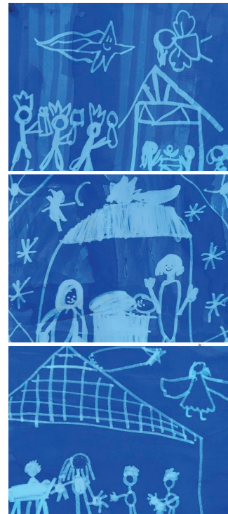
Krippen auf Tinte, gemalt von Volksschüler:innen

Es geschah aber in jenen Tagen, dass Kaiser Augustus den Befehl erließ, den ganzen Erdkreis in Steuerlisten einzutragen. Diese Aufzeichnung war die erste; damals war Quirinius Statthalter von Syrien. Da ging jeder in seine Stadt, um sich eintragen zu lassen. So zog auch Josef von der Stadt Nazaret in Galiläa hinauf nach Judäa in die Stadt Davids, die Betlehem heißt; denn er war aus dem Haus und Geschlecht Davids. Er wollte sich eintragen lassen mit Maria, seiner Verlobten, die ein Kind erwartete. Es geschah, als sie dort waren, da erfüllten sich die Tage, dass sie gebären sollte, und sie gebar ihren Sohn, den Erstgeborenen. Sie wickelte ihn in Windeln und legte ihn in eine Krippe, weil in der Herberge kein Platz für sie war. In dieser Gegend lagerten Hirten auf freiem Feld und hielten Nachtwache bei ihrer Herde. Da trat ein Engel des Herrn zu ihnen und die Herrlichkeit des Herrn umstrahlte sie